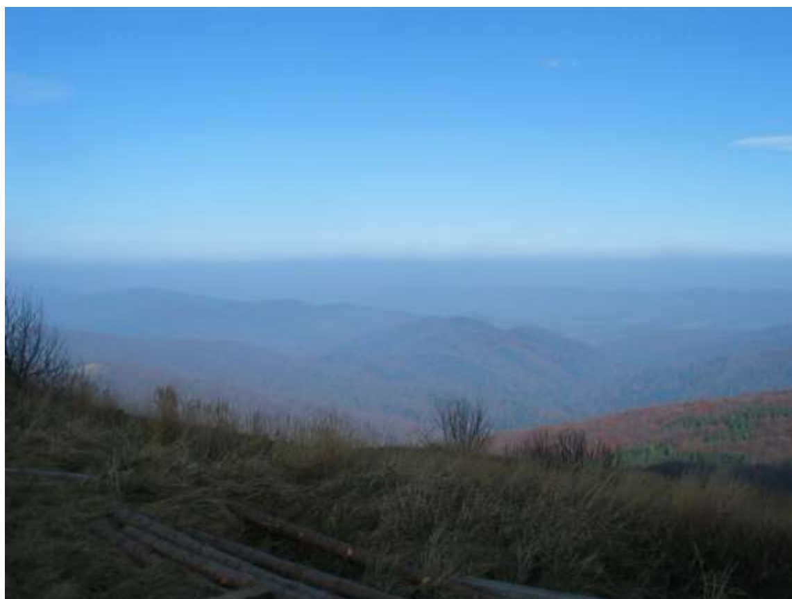
Zdjęcie 30, 31

Chwila odpoczynku przy schronisku „Chatka Puchatka” będącym pozostałością WOP oraz urzekająca panorama gór spowitych mgłą.