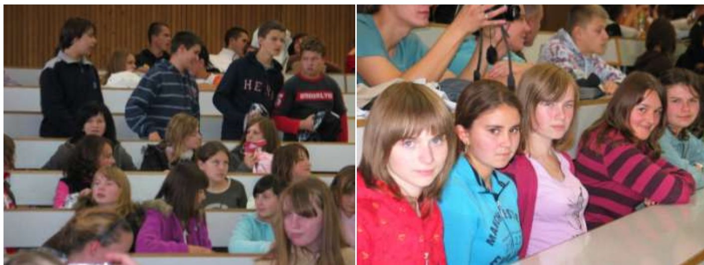
Zdjęcie 11, 12, 13

Oczekiwanie na pokazy z fizyki –wspólne zdjęcie przy pomniku M. Skłodowskiej – Curie przed Uniwersytetem oraz w auli wykładowej.