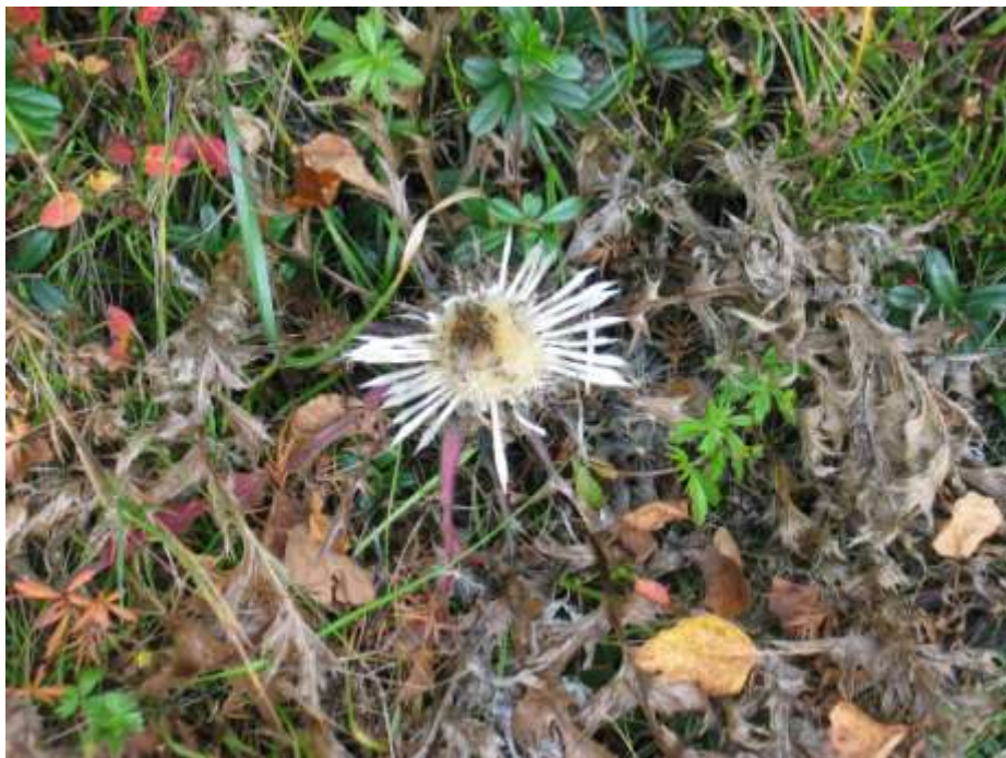
Zdjęcie 32, 33, 34

Droga powrotna czerwonym szlakiem turystycznym. Jesienny pejzaż z Połonią Caryńską w tle, bieszczadzką buczyną oraz dziewięsił bezłodygowy.