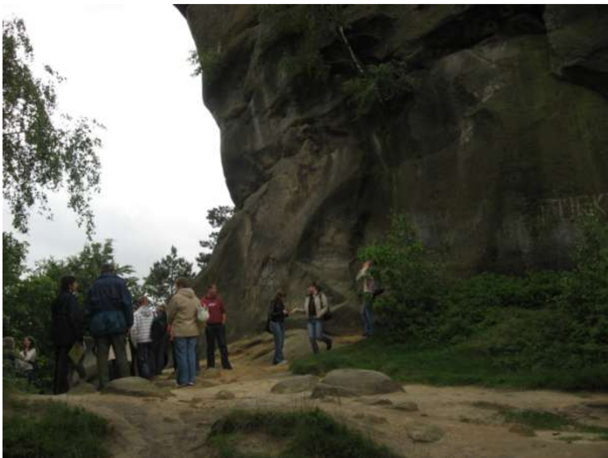
Ścieżka przyrodniczo – dydaktyczna Prządki – Zamek Kamieniec: